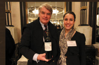
波尔多名庄联合会世界巡展推广