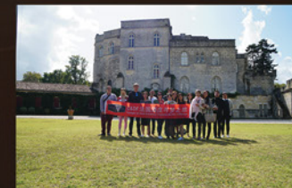
酒庄游及品鉴活动